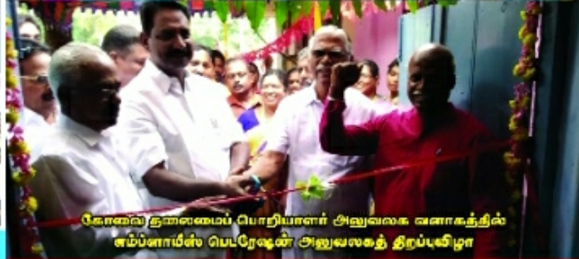
கோவை தலைமைப் பொறியாளர் அலுவலக வளாகத்தில் எம்ப்ளாயீஸ் பெடரேஷன் அலுவலகத் திறப்பு விழா

Printed by D.Datta, Published by A. Sekizhar on Behalf of Tamil Nadu Electricity Board Employees Federation 39-101 Ring Road, Chennai, Chennai 600037 2nd Floor, St. No. 6/2, Singaperumal, Chennai 600017 Editor : A. SURESH 36