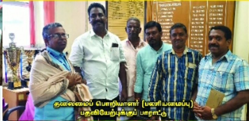
தலைமைப் பொறியாளர் (பணியமைப்பு) பதவியேற்றுக்கும் பாராட்டு